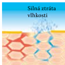
Při nedostatku kyseliny linolové dochází k narušení ochranné kožní bariéry

K ochraně pokožky před poruchami bariéry či ztrátami tuku a vody je nezbytné zajistit její nepřetržitě zásobování lipidy a jinými důležitými látkami. Řada Linola nabízí přípravky s jedinečnou recepturou s obsahem kyseliny linolové, která pomáhá tuto ochrannou kožní bariéru obnovovat a stabilizovat.