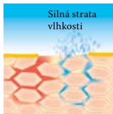
Pri nedostatku kyseliny linolovej dochádza k narušeniu ochrannej kožnej bariéry

K ochrane pokožky pred poruchami bariéry či stratami tuku a vody je nevyhnutné zaistiť jej nepretržité zásobovanie lipidmi a inými dôležitými látkami. Rad Linola ponúka prípravky s jedinečnou receptúrou s obsahom kyseliny linolovej, ktorá pomáha túto ochrannú kožnú bariéru obnovovať a stabilizovať.